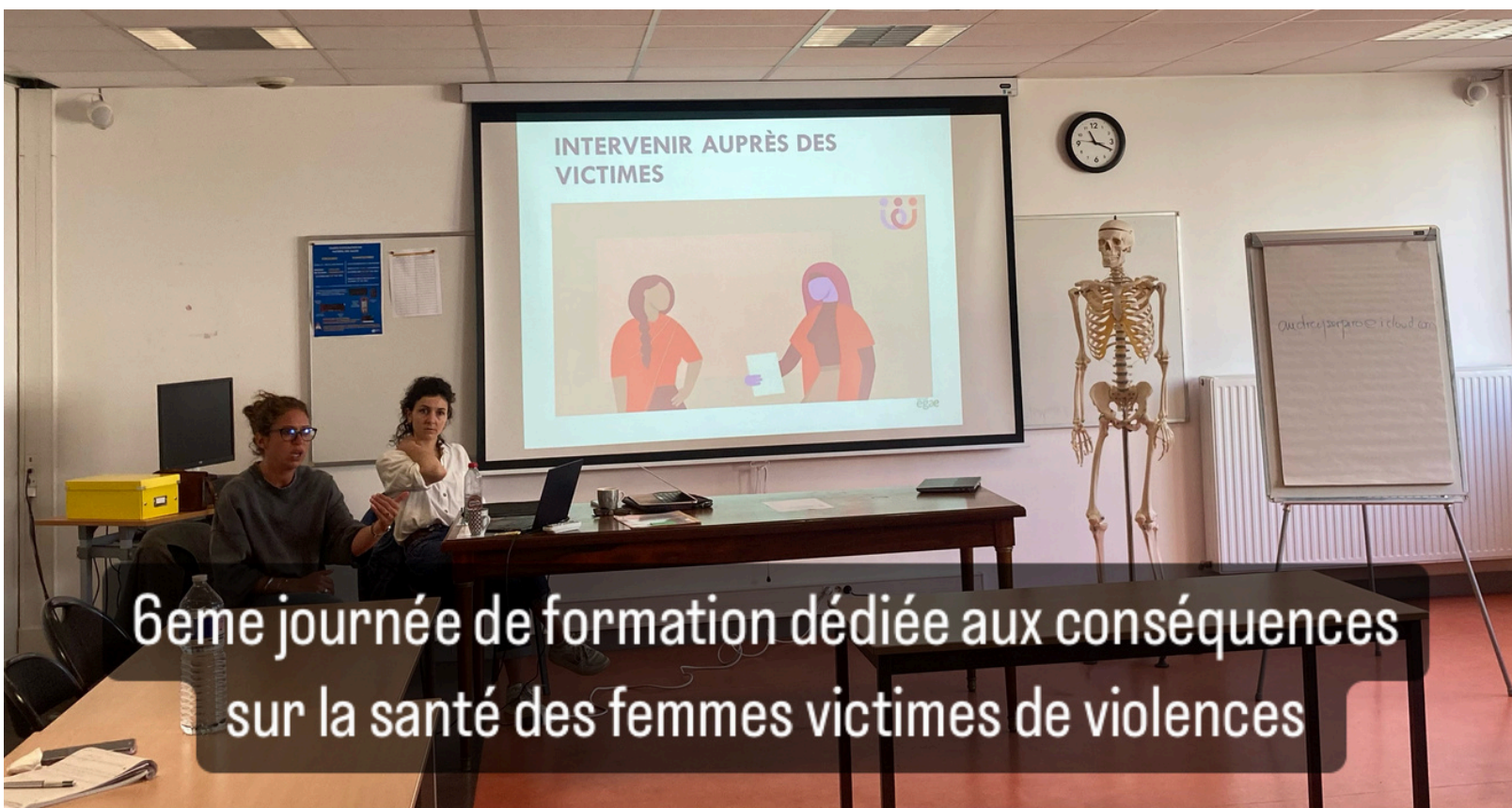
6eme journée de formation dédiée aux conséquences sur la santé des femmes victimes de violences