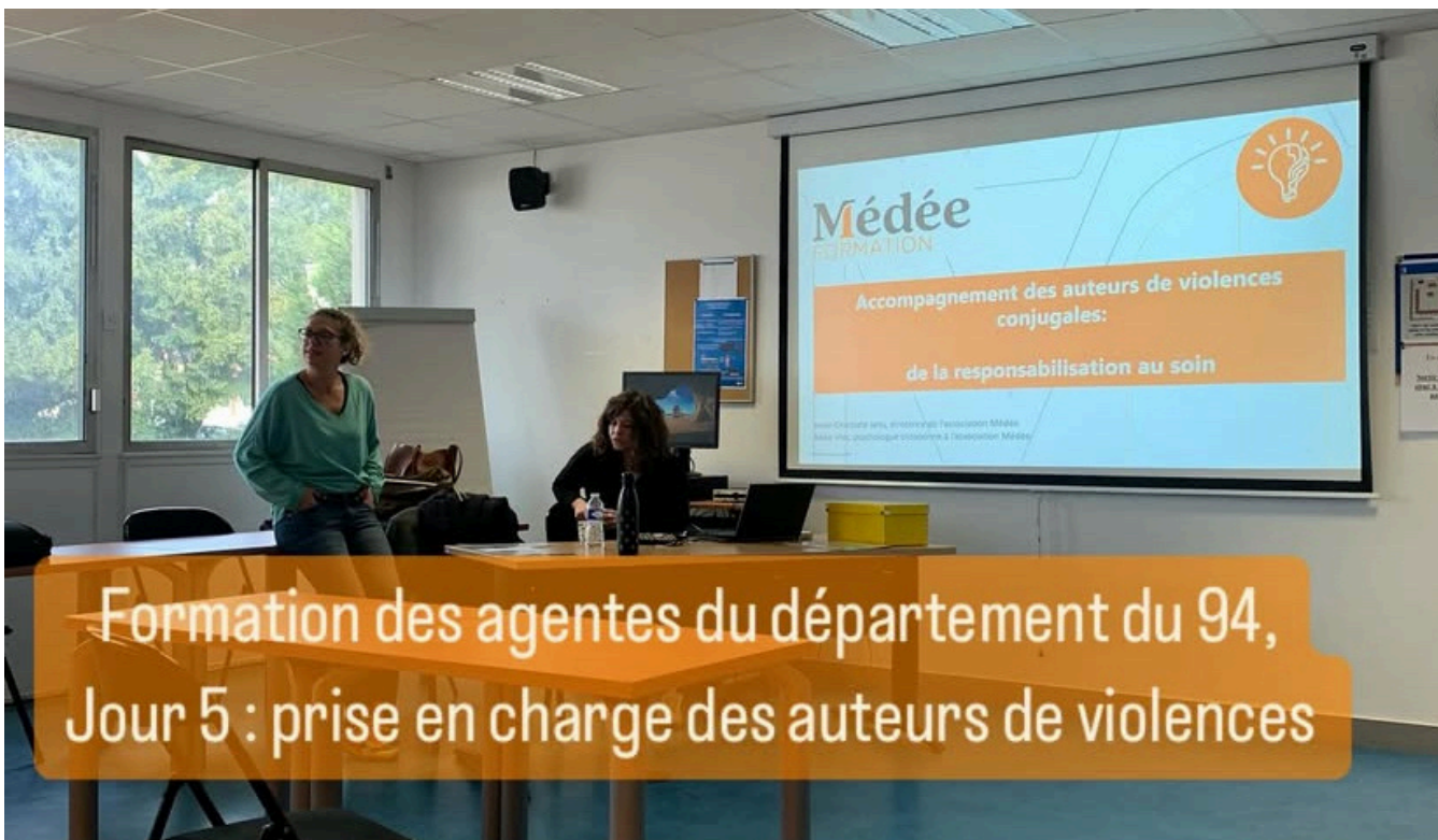
Formation des agentes du département du 94, Jour 5 : prise en charge des auteurs de violences